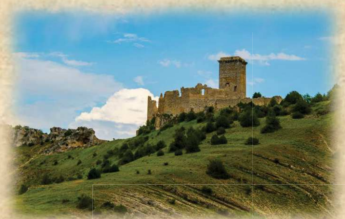
Castillo templario de Ucero