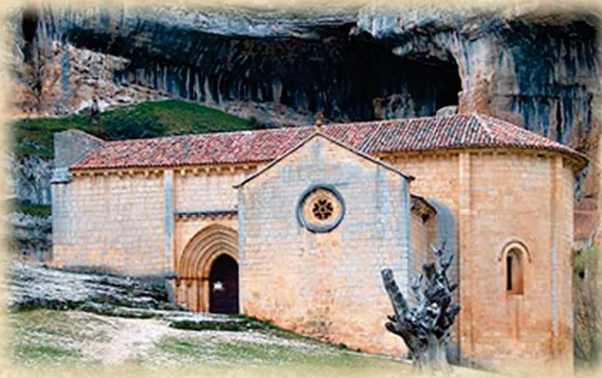
Ermita de San Bartolomé